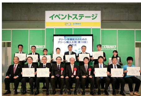
グリーン購入大賞表彰式の様子

「グリーン購入大賞」を通して、グリーン購入の普及・拡大に取り組む優良事例を表彰しています。応募団体の中から大賞、優秀賞が選ばれるとともに、特に優秀な取り組みに大臣賞(環境大臣賞、経済産業大臣賞、農林水産大臣賞)が授与されます。