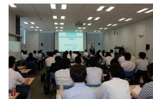
グリーン購入担当者向け研修会の様子

セミナーやイベント、会員団体との協力による企画等を通じ、会員相互の交流を図っています。また、行政、企業、民間団体等、多様な分野の会員間の情報交換や連携により、環境にかかわるさまざまな課題に取り組んでいます。